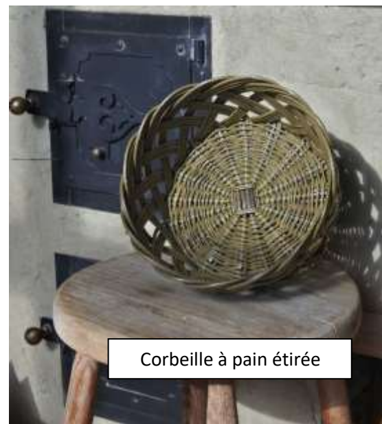
Corbeille à pain étirée

Bulletin d'inscription à expédier à Séverine Boyer 8 route de Gué Droit FR-37190 Saché