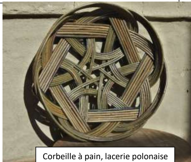
Corbeille à pain, lacerie polonaise